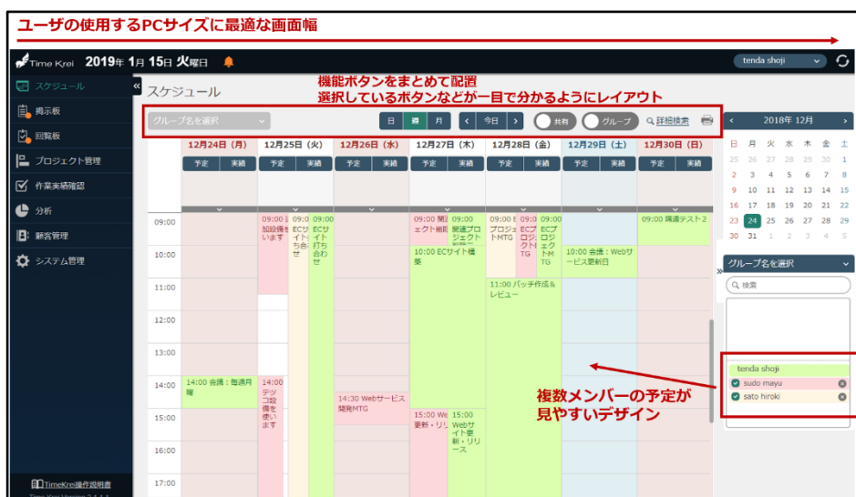
[スケジュール画面]