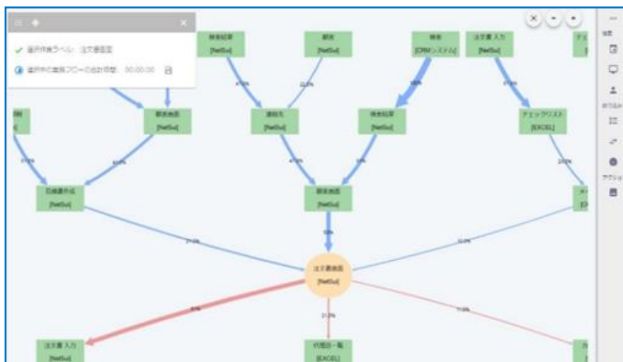
[D-Analyzer Server フローチャートイメージ図]

*3 Dojoは、100%テンダの内製により企画・設計・開発されたソフトウェアです