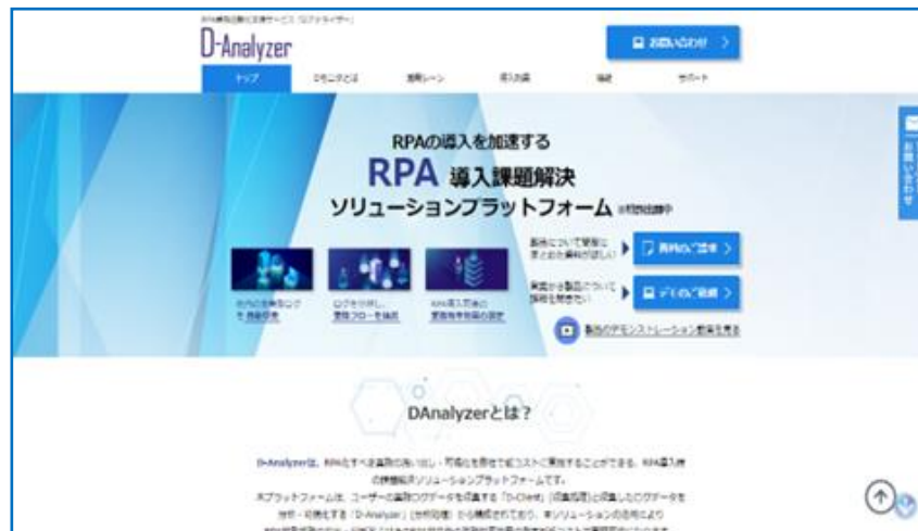
[D-Analyzerサービス公式サイト]