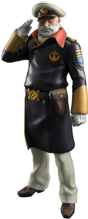
(右写真) ヤマトガイズコレクション 沖田十三

SP : http://mixi.jp/run_appli.pl?id=41031