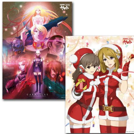
(上写真) 宇宙戦艦ヤマト 2199 クリアポスターセット III